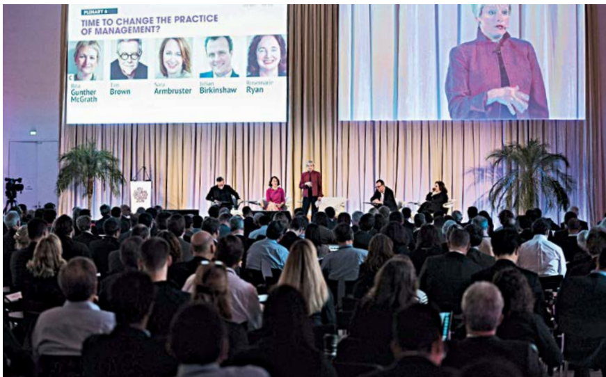
Drucker Forum 2016. Etwa 500 Personen kamen im November nach Wien, um Druckers Vision von einer unternehmerischen Gesellschaft zu diskutieren.