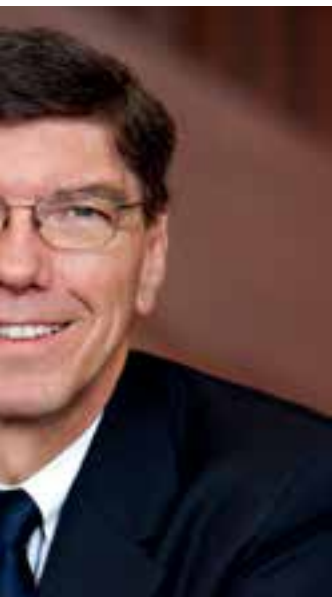
从左至右按顺时针方向： 克莱顿·克里斯滕森、盖里·海默尔、 罗杰·马丁和约翰·黑格尔三世